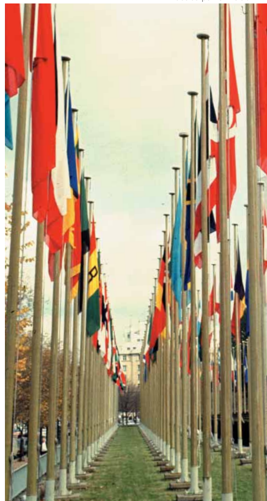
Quadre 1 // Acords d'associació entre la UE i els PTM