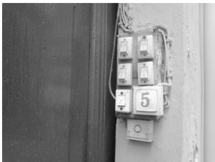
El número 5.