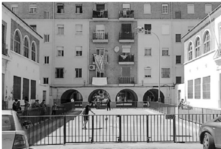
Camp de futbol.