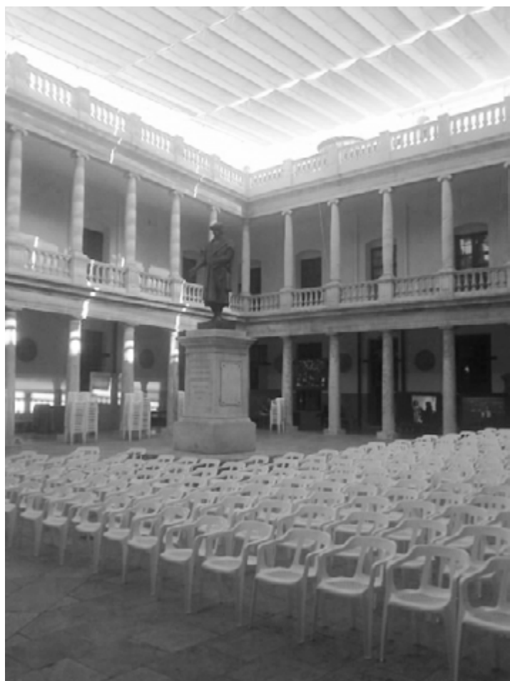
Nits de cinema.