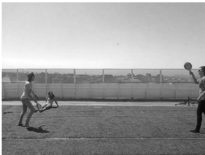
Càmping en el pont.