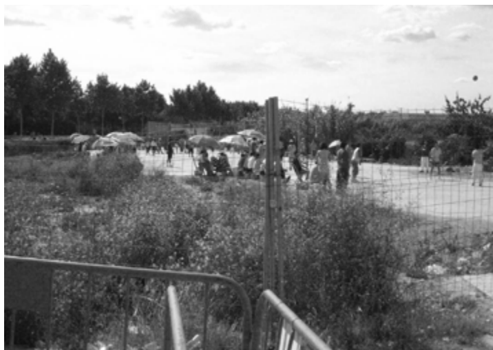
Descampat «habitat» en Pasqua. Bulevard Sud, València.