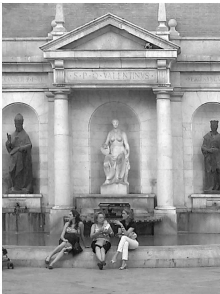
Tir a l'angle.